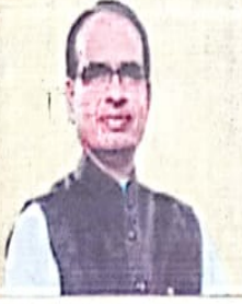
श्री शिवराज सिंह चौहान, मुख्यमंत्री